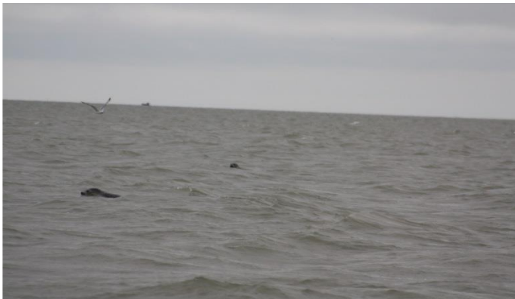
Рисунок 2. Характерные положения тюленя рядом с движущейся моторной лодкой (предустьевое пространство реки Урал, 18.11.2015 г.,)

измерение дальности. Кроме того, тюлени всплывают неожиданно, периодически ныряют и не постоянно сопровождают судно, движущееся со скоростью около 7–10 узлов. Шум двигателя, приближение судна и время наблюдений, преимущественно — апрель или октябрь, позволяют с большой долей уверенности утверждать, что тюлени не пребывают в спокойствии — лежащими в воде, и будут встречаться в позиции плывущих или наблюдающих — высунувших из воды голову (рис. 2). Поэтому и размеры объектов № 2 и № 3 имитировали именно эти положения тюленей.