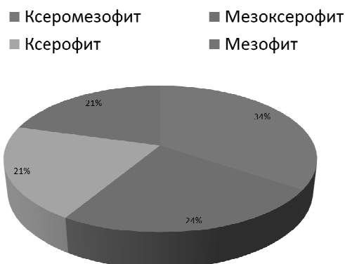
1-сурет. Эфемерлер мен эфемероидтардың экологиялық топтары бойынша жіктелуі

Сол сияқты тіркелген өсімдіктер экоморфасына және өмір сүру формасына байланысты жіктелді. Олардың нәтижелері 1-ші суретте көрсетілген.