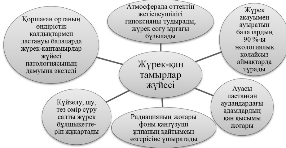
1-сурет. Жүрек-қан тамырлар жүйесіне кері әсер етуші факторлар (5)

Жоғарыда аталған жүрек-қан тамырлар жүйесі ауруларының ХХІ ғасыр адамзатына төндіріп отырған қаупі аса зор. Біздің елдің демографиялық жағдайларына да тигізетін кері әсері зор. Орталық Қазақстан аймағы, яғни Қарағанды облысы, халқының соңғы он жылдықтардағы демографиялық көрсеткіштеріне кері әсерін тигізуші бір фактор ретінде осы ауру түрлерін атауға болады. Бұл ауру түрлерімен сырқаттану деңгейінің соңғы 5 жылдағы көрсеткіштеріне (кестені қара.) қарайтын болсақ, аталған аурулармен сырқаттану деңгейінің де, осы дерт салдарынан қайтыс болу көрсеткіштерінің де жоғары екенін көреміз [6].